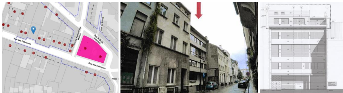
Contexte patrimonial – vue de l'immeuble et élévation projetée (extr. du dossier de demande)

En réponse à votre courrier du 24/08/2023, reçu le 25/08/2023, nous vous communiquons l'avis émis par la CRMS en sa séance du 06/09/2023, concernant la demande sous rubrique.