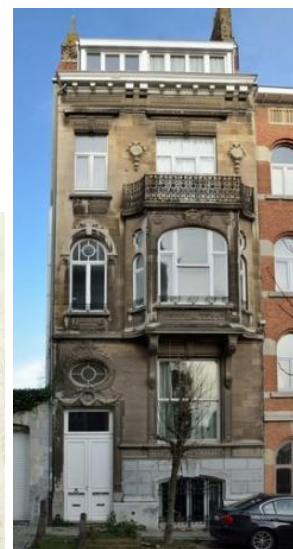
Contexte patrimonial (©Brugis) – plans d'origine (1912) et vue de la maison (extr. du dossier de demande)

Reprise à l'Inventaire du patrimoine et partiellement située dans la zone de protection de la prison de Forest, cette maison de style Beaux-Arts a été réalisée en 1912 d'après les plans de l'architecte D. Fastré. Le projet porte sur la rénovation de l'appartement du R+1, avec le remplacement à l'identique (ou leur restauration) des châssis en façade avant, la réunion par un petit escalier intérieur du palier intermédiaire et du 1 er étage, la création d'un balcon arrière et le remplacement des châssis de la façade arrière (en vue aussi d'isoler celle-ci prochainement).