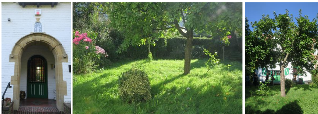
Vues avant et arrière de la maison (extr. du dossier de demande), vues de la cheminée, de l'enfilade salle à manger-salon, de la cage d'escalier, du bureau du poète, de la porte d'entrée et du jardin