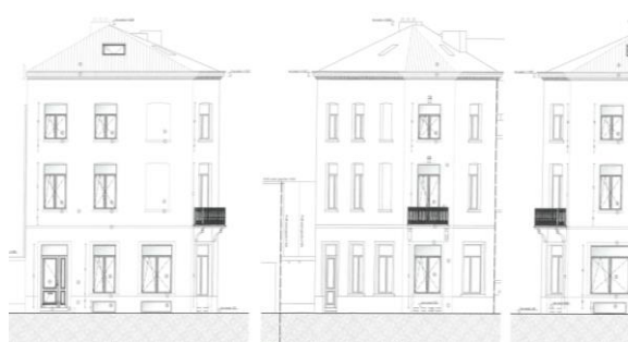
Élévation projetée des façades à rue. Images tirée du dossier.