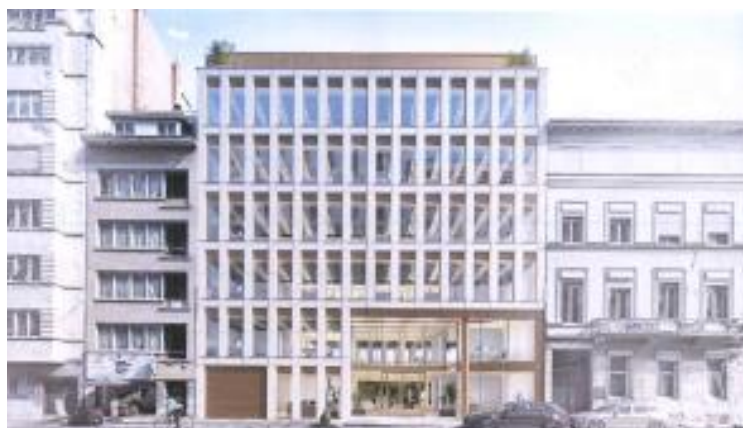
Photomontage de la situation projetée. Image tirée du dossier

La CRMS apprécie le sérieux avec lequel le potentiel de maintien/reconversion du bâtiment existant a été étudié, et compte tenu des éléments de motivation avancés dans le dossier, elle ne s'oppose pas, pour cette demande, à un projet de démolition/reconstruction. Néanmoins, cette nouvelle construction doit être l'occasion de concevoir un immeuble qui s'articule mieux aux remarquables bâtiments néoclassiques classés qui lui sont contigus et qui sont deux témoins « survivants » de ce qu'était le quartier Léopold au moment de sa première urbanisation. En effet, la CRMS estime que la composition de la façade du nouveau bâtiment devrait mieux s'articuler et rentrer en dialogue avec les bâtiments voisins classés et qu'à cet égard le double rez-de-chaussée de l'immeuble actuel offre une meilleure réponse.