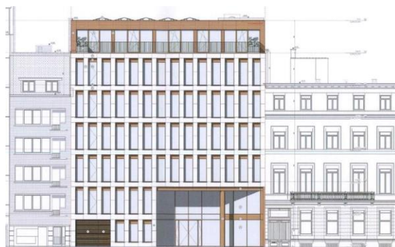
Élévation projetée.

Le bâtiment a fait l'objet d'études de faisabilité portant sur son adaptation potentielle, suivant un scénario de réaffectation en immeuble de logements et un scénario en immeuble de bureaux. La démolition est justifiée dans la note explicative par la faible hauteur de dalle à dalle, la faible hauteur sous poutre, une retombée de poutre en façade avant, la profondeur importante du bâtiment. Un bilan carbone est joint à la demande de reconstruction et compare plusieurs scénarii, dont celui de la démolition et celui du maintien de la structure existante.