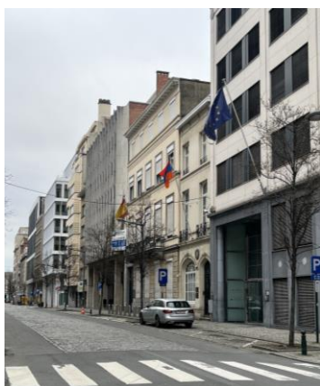
Photo de la situation actuelle.