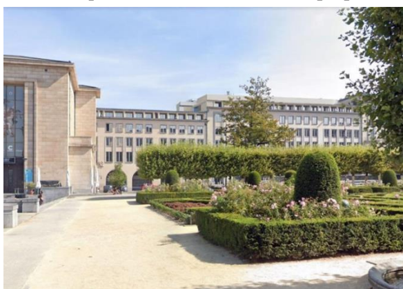
Photomontage depuis le Mont des Arts. Proposition bardage beige rosé – janvier 2024

Souscrivant à une démarche permettant d'améliorer la situation actuelle particulièrement impactante et dévalorisante pour l'ensemble sauvegardé, la CRMS questionnait cependant la proposition de janvier 2024 qui prévoyait la réalisation d'un bardage métallique de teinte beige et demandait de fournir des compléments d'informations. Elle craignait que la tonalité beige proposée, introduise la lecture d'un nouvel étage au détriment de la lisibilité des volumétries et façades originelles. Mais aucun visuel ni détail ni mock-up ne permettait de réellement l'apprécier, ce qui a justifié la demande de compléments d'infos, lesquels ont introduit une autre proposition.