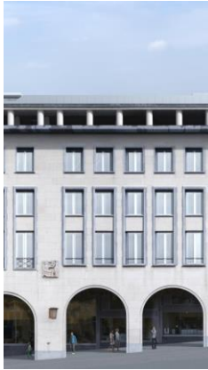
Photomontage depuis le Mont des Arts. Proposition en zinc-compléments d'infos mars 2024