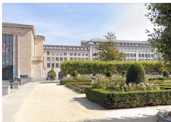
Photomontage depuis le Mont des Arts. Proposition en zinc-compléments d'infos mars 2024

Dans ce contexte particulier de modification de la demande initiale, la Crms rend un avis défavorable sur la première proposition (documents analysés en séance du 10/01/2024) mais est, par contre, favorable à la variante proposée dans les documents complémentaires (compléments d'infos analysés en séance du 13/3/2024). Cette variante permettra de camoufler les installations avec sobriété et atténuation, sans créer la lecture d'un nouvel étage ni prolonger le registre des façades. La matérialité du zinc semble apporter la discrétion nécessaire. La solution du plan incliné est par ailleurs intéressante puisqu'elle permet d'atténuer le volume d'accorder le traitement à celui d'autres volumes présents autour du Mont des Arts. L'intervention est par ailleurs réversible. La CRMS souscrit également aux panneaux photovoltaïques.