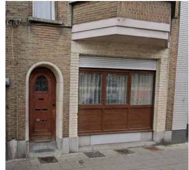
Façade existante

Selon la CRMS, les actes et travaux consignés dans la demande ont un impact visuel très limité sur la Maison communale classée. En revanche, sur le plan architectural, les nouvelles menuiseries installées dans la baie du rez-de-chaussée sont peu appropriées en termes de composition, de proportions de pleins et de vides et du choix des matériaux, et ne sont pas en phase avec la typologie de la façade concernée. Le projet devrait être amélioré sur ce point.