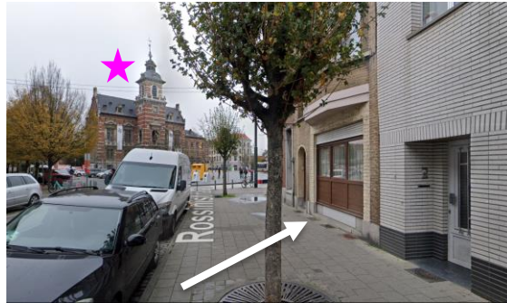
Implantation par rapport au bien classé