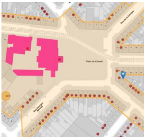
Localisation du projet

En réponse à votre courrier du 30/04/2024, nous vous communiquons l'avis émis par la CRMS en sa séance du 15/05/2024, concernant la demande sous rubrique.