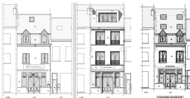
Situation existante et, projets de 2023 et 2024 pour la façade à rue (documents extraits des demandes respectives)

Selon la CRMS, le nouveau projet pour la façade à rue constitue une amélioration par rapport à la demande précédente. Cependant, la charge programmatique rend le projet toujours fort impactant. L'option d'aménager deux chambres en façade à rue est restée inchangée, ce qui, tout comme dans la version antérieure, nécessite des ajustements aux baies de fenêtres en façade avant. Cette modification compromet la typologie du bien, appartenant à l'ancien paysage villageois (tout comme le nombre de véliques en toiture avant, ou la composition de la façade arrière).