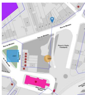
Localisation du projet

En réponse à votre courrier du 06/05/2024, nous vous communiquons l'avis émis par la CRMS en sa séance du 15/05/2024, concernant la demande sous rubrique.