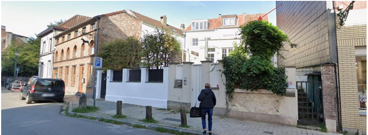
Vue du tronçon de la rue Saint-Guidon concerné par la protection, avec la maison n°29

La maison concernée par la demande comprend une partie avant et une annexe accolée à l'arrière, ce qui lui confère plusieurs façades. En 2002, cette habitation a été en grande partie, voire totalement, reconstruite « à l'identique », suite à une explosion de gaz. La CRMS avait alors rendu l'avis suivant lors de sa séance du 18/09/2002 : « La Commission ne s'oppose pas au principe d'une réparation / reconstruction à l'identique. Elle aurait toutefois souhaité que soit modifiée l'expression architecturale de la façade donnant sur la rue Saint-Guidon, actuellement précédée d'une véranda fort banale en p.v.c. La Commission estime que cet élément ne correspond pas du tout au caractère pittoresque des lieux. »