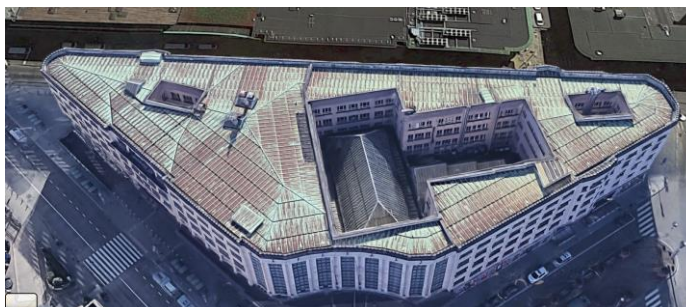
Inplanting van het project en bestaande toestand van het dak

Het besluit van 16/03/1995 schrijft het Centraal Station als monument in op de bewaarlijst. De vrijwaring betreft de buitengevels van het bouwblok, de daken, de oorspronkelijke inwendige structuur, de lokettenhal en de trap die vandaar leidt naar de eerste ondergrondse tussenverdieping.