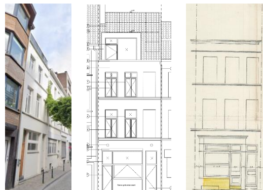
Sit.ex., project et sit. d'origine (doc. extr. du dossier de demande)

Le réaménagement en un commerce et un logement, n'appelle pas de remarque au niveau patrimonial. En revanche, le projet devrait être amélioré en ce qui concerne la façade avant : la nouvelle devanture devrait s'inspirer davantage du dessin historique (hauteur de l'allège, proportions et division châssis), et la lucarne devrait être revue tant au niveau de son dessin qu'au niveau de ses dimensions et implantation (à centrer).