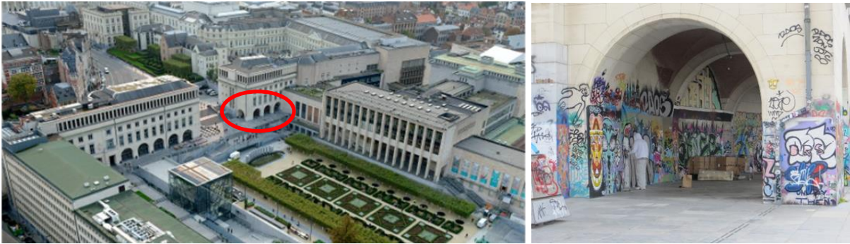
Vue aérienne du Mont des Arts (extr. de https://www.regiedergebouwen.be/fr/projects/mont-des-arts , 2018) avec l'emplacement du projet - Vue des tags en place après 2015 (©CRMS)

Un P.V. d'infraction a été dressé le 20/06/2023 (ref INF/1904935 – PV-ISA/2023-48) concernant l'installation de ces grilles.