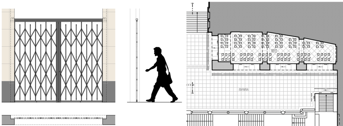
Élévation des grilles et plan de l'installation du mobilier de terrasse (extr. du dossier de demande)

Aujourd'hui, la demande, émanant de l'exploitant de la brasserie sise de l'autre côté de l'escalier, porte sur la régularisation des grilles mises en place et sur l'installation d'une terrasse Horeca dans cet espace couvert. Ces éléments de fermeture, réalisés en acier brut, sont placés dans les baies des arcades et se replient derrière les pilastres. Il est prévu d'en démonter les vantaux et de les laquer dans un ton foncé avant de les remettre en place. La dernière grille a été placée afin d'empêcher de manière provisoire l'accès à la galerie. Concernant l'exploitation de la terrasse (129m 2 ), il est précisé que seul des éléments démontables et mobiles seront utilisés et qu'il n'y aura pas d'ajout d'enseigne ni de tentes solaires.