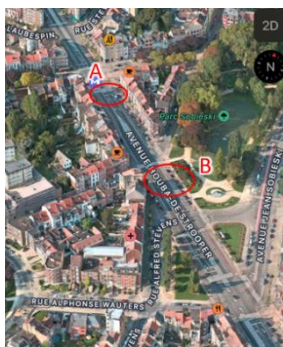
Vue aérienne de l'accès existant (A) et du nouvel accès prévu (B). (© Apple Plans)