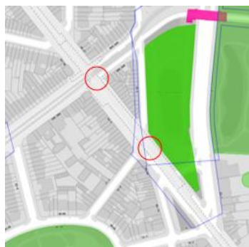
Contexte patrimonial

En réponse à votre courrier du 28/05/2024, nous vous communiquons l'avis émis par la CRMS en sa séance du 15/05/2024, concernant la demande sous rubrique.