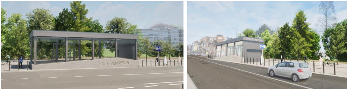
Visualisations 3D du nouvel édicule « Bockstael » (visuels extraits du dossier de demande).