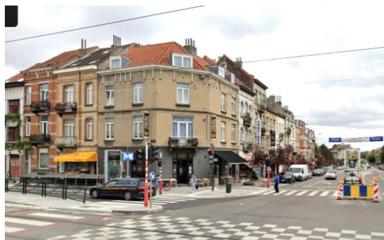
Accès actuel de la station au croisement de l'avenue Houba de Strooper et du boulevard de Smet de Naeyer