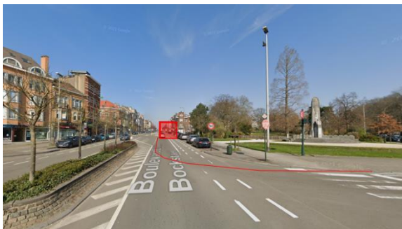
Vue actuelle du boulevard Bockstael et du square Clémentine. En surimpression, l'emprise du nouveau trottoir et de l'édicule d'accès à la station de métro (© Google Streetview / Annotations CRMS).

La CRMS rappelle que la création d'accès aux stations de transport en commun, bien qu'elle soit conditionnée par des contraintes fonctionnelles, doit aussi, comme toute intervention dans l'espace public, se réaliser dans le respect et la compréhension du paysage urbain extérieur et reposer sur une vision globale des lieux et de leurs caractéristiques spatiales et esthétiques (composition, perspectives, matériaux, formes urbaines, végétation, colorimétrie, etc.) 1 . Cet objectif n'est pas atteint ici et l'atteinte au paysage urbain est important. La CRMS demande de revoir le projet du nouvel édicule dans le sens d'une meilleure intégration, en renonçant à l'implantation à même le boulevard , par exemple en l'intégrant avec finesse et grand soin au plan du square Clémentine.