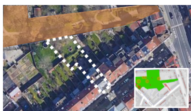
Inplanting van het pand

In antwoord op uw brief van 14/05/2024, ontvangen op 15/05/2024, sturen wij u het advies dat onze Commissie over bovengenoemd onderwerp uitgebracht heeft tijdens haar vergadering van 05/06/2024.