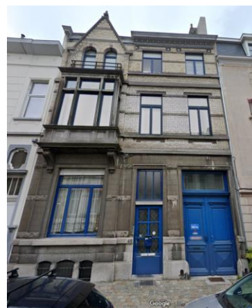
Bestaande toestand voorgevel

De voorliggende plannen betreffen de derde versie van deze aanvraag. De twee eerdere versies werden door de KCML behandeld tijdens haar zittingen van 21/09/2022 en 29/11/2023.