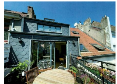
Profil de la toiture et relation avec le milieu du n° 11