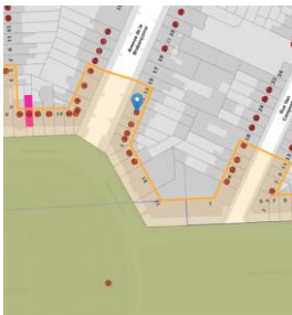
Contexte patrimonial

En réponse à votre courrier du 12/06/2024, reçu le 13/06/2024, nous vous communiquons l'avis émis par la CRMS en sa séance du 26/06/2024, concernant la demande sous rubrique.