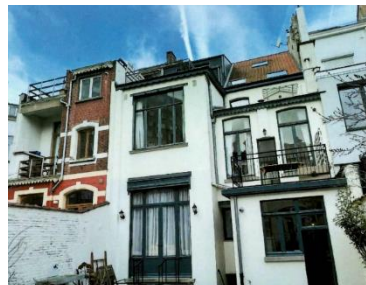
Détail des toitures aile principale de gauche