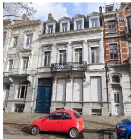
Façade avant