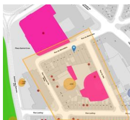
Contexte patrimonial.

En réponse à votre courrier du 29/05/2024, reçu le 31/05/2024, nous vous communiquons l'avis émis par la CRMS en sa séance du 26/06/2024, concernant la demande sous rubrique.