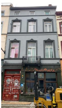
Façade avant (photographie extraite du dossier).