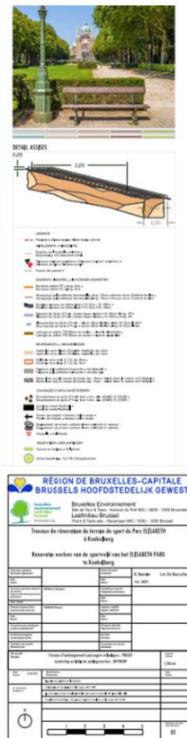
Plans existant et projeté (extr. du dossier de demande)