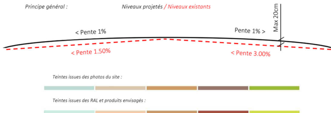
Coupe avec la correction des pentes – Gamme de teintes en place et projetée (extr. du dossier de demande)