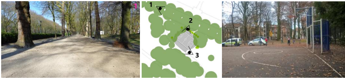
Situation actuelle : vues et plan du terrain de sport (extr. du dossier de demande)

possibilités quant à d'autres pratiques sportives ou ludiques. Il s'intègre également peu au site, même si, par sa position intéressante en retrait, il ne perturbe nullement les vues principales.