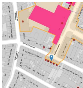
Contexte patrimonial

En réponse à votre courrier du 05/06/2024, nous vous communiquons l'avis émis par la CRMS en sa séance du 26/06/2024, concernant la demande sous rubrique.