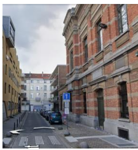
Vue de l'enfilade néoclassique et du bien concerné par la demande