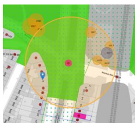
Localisation de l'immeuble

En réponse à votre courrier du 07/06/2024, nous vous communiquons l'avis émis par la CRMS en sa séance du 26/06/2024, concernant la demande sous rubrique.