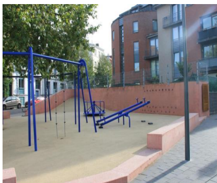
Vue de la situation existante de la plaine de jeux

En réponse à votre courrier du 25/06/2024, nous vous communiquons l'avis émis par la CRMS en sa séance du 10/07/2024, concernant la demande sous rubrique.