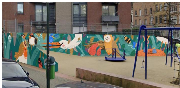
Vue projetée, avec la fresque de la plaine de jeux Images tirées du dossier.