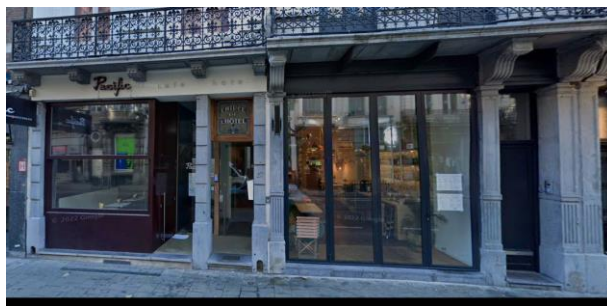
Devanture existante et projetée (© Google Streetview et plan extrait de la demande)