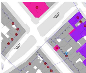
Localisation du projet

En réponse à votre courrier du 06/08/2024, nous vous communiquons l'avis émis par la CRMS en sa séance du 21/08/2024, concernant la demande sous rubrique.