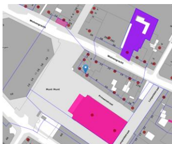
Localisation du projet

En réponse à votre courrier du 13/08/2024, nous vous communiquons l'avis émis par la CRMS en sa séance du 21/08/2024, concernant la demande sous rubrique.