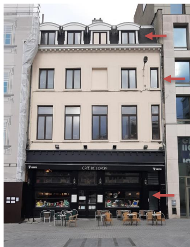
Façade à rue, états existant et projeté (documents extraits de la demande)