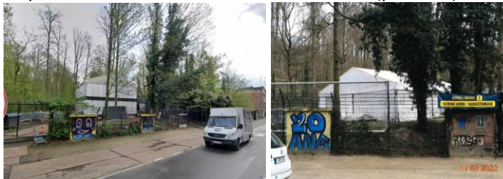
Vue de la tente depuis la chaussée de Bruxelles (extraits du dossier)

- l'installation, au nord du stade, d'une tente événementielle « Presse/VIP/Player's Lounge » composée d'une structure métallique et de parois en toile blanche sur deux niveaux (point 1b).