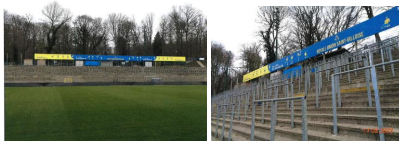
Vues du panneau publicitaire (extraits du dossier)

- le placement d'un grand panneau publicitaire « be.union, b.brussels-Royale Union Saint-Gilloise » au-dessus de la tribune est (point 1g) : de manière générale, la CRMS plaide pour des dispositifs publicitaires plus qualitatifs et uniformes (matériaux, couleurs....). Ces dispositifs devront également être intégrés dans la réflexion globale du futur aménagement et développement du club.