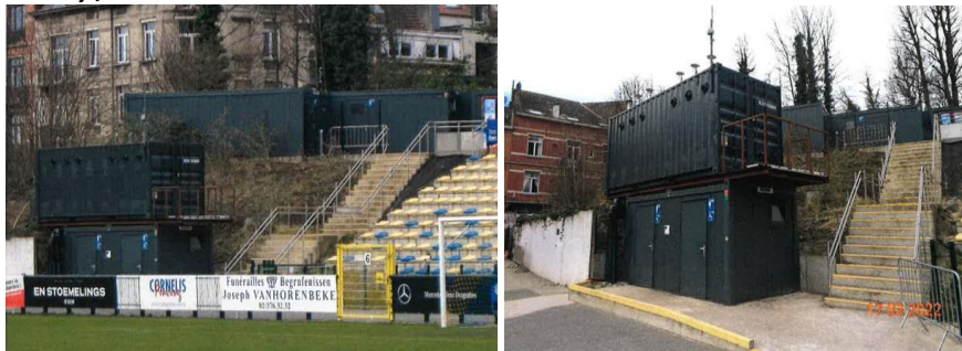
Vue des deux containers supersposés à gauche de la tribune nord (extraits du dossier)

Les plantations de cette zone devront impérativement être renforcées pour améliorer notamment leur interface avec l'espace public. A terme dans le cadre d'une réflexion globale, ces installations devront être intégrées de manière plus discrète (chaufferie combinée à celle du bâtiment historique ou logée dans un volume semi-enterré ?) ;