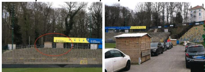
Vues des cabanons en bois (extraits du dossier)

- le placement de quatre cabanons (buvettes, type chalet en bois) dans l'enceinte-même du stade (deux à l'arrière gauche de la tribune est et deux autres aux abords du terrain en bas de la tribune sud), motivé par des mesures de sécurité et de services imposées dans les stades de ce niveau (point 1f) : La CRMS demande de remplacer les cabanons en bois par des structures plus qualitatives et mieux intégrées ;