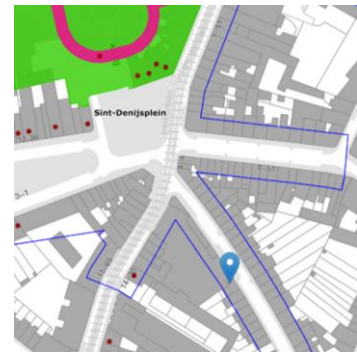
Localisation du projet

Veuillez agréer, Monsieur l'Échevin, l'expression de nos sentiments distingués.