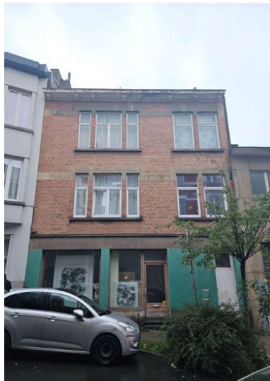
Facade à rue (photo jointe à la demande)

L'augmentation de volume en toiture et l'aménagement d'une terrasse en façade arrière du dernier étage relèvent d'un examen urbanistique plutôt que patrimonial.