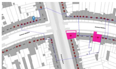
Localisation du projet

En réponse à votre courrier du 06/08/2024, nous vous communiquons l'avis émis par la CRMS en sa séance du 21/08/2024, concernant la demande sous rubrique.