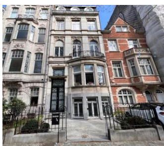
État de la façade (photo jointe à la demande)