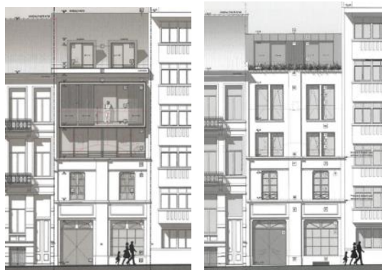
Ancienne et nouvelle version du projet – extr. de la demande

occasion, elle demandait cependant de revoir le dessin et la qualité de composition de la rehausse en façade avant, afin de s'intégrer plus finement et subtilement dans le contexte néoclassique et éclectique du quartier.