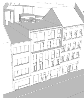
Situation projetée (documents extraits du dossier de demande)