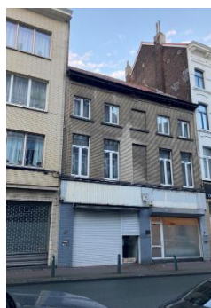
Situation existante