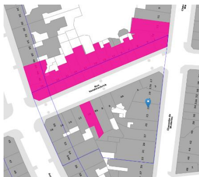
Contexte patrimonial (© BruGIS)

La demande concerne deux maisons néoclassiques jumelées de type R+2+combles, caractéristiques du bâti ancien bordant la chaussée de Waterloo. Elles se situent dans la zone de protection de la maison classée sise au 10, rue Vanderschrick, ainsi qu'en ZICHEE . Les deux biens ont connu une série de transformations au xx e siècle : parement des façades en briques, réaménagement et jonction des espaces intérieurs, adjonction de devantures commerciales, remplacement des châssis en bois par des châssis en PVC.