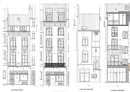
Situation existante et situation projetée (documents extraits du dossier de demande)

La CRMS accepte la rehausse de cette maison néoclassique, mais demande de réduire le gabarit des deux lucarnes projetées en toiture côté rue, dont les proportions ne sont pas en phase avec la composition de la façade. Il y a lieu de respecter le principe de dégressivité des baies. Le dessin des châssis devrait également être amélioré (typologie avec deux ouvrants sous imposte, caractéristique de l'architecture néoclassique). Le plus grand soin devra être apporté au remontage de la corniche historique (réemploi maximal des éléments en bois d'origine, restitution du cordon mouluré et des cache-boulins).