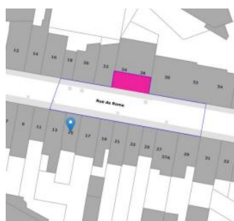
Contexte patrimonial

En réponse à votre courrier du 08/08/2024, nous vous communiquons l'avis émis par la CRMS en sa séance du 21/08/2024, concernant la demande sous rubrique.