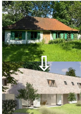
Constructions existantes et projetées, images extraites de la demande

Les interventions projetées n'auront pas d'impact défavorable sur les perspectives vers et depuis le parc de l'ancien Couvent des Religieuses de l'Eucharistie, classé comme site. Le projet n'appelle dès lors pas de remarques d'ordre patrimonial.