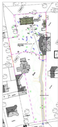
Plans de l'implantation existante et projetée, extraits de la demande

En réponse à votre courrier du 01/08/2024, nous vous communiquons l'avis émis par la CRMS en sa séance du 21/08/2024, concernant la demande sous rubrique.