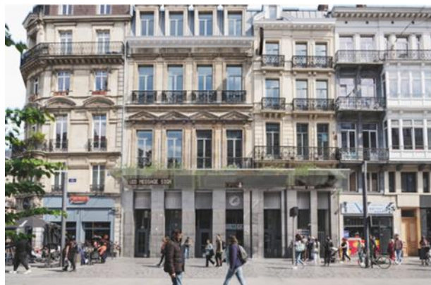
Rendering van het project - uit het aanvraagdossier

Het beleidsplan van de AB voorziet ook in een vergroening van de gevel om een bijdrage te leveren aan de verbetering van het stadsklimaat. Met het huidige voorstel van 'groene luifel' wenst men beide doelstellingen te combineren.