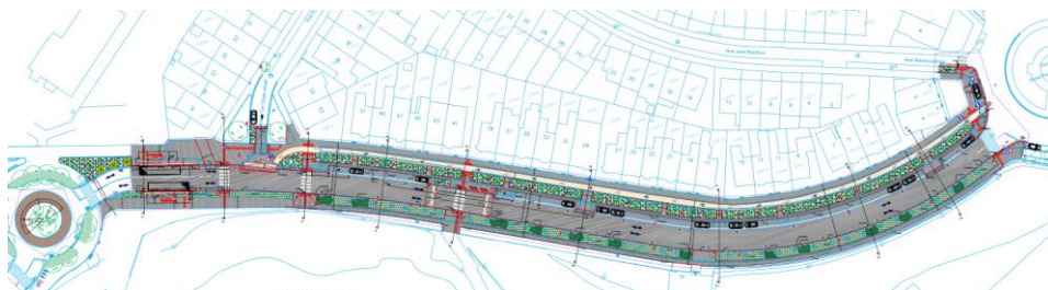
Situation projetée (document extrait du dossier de demande)