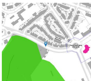
Contexte patrimonial

En réponse à votre courrier du 22/08/2024, nous vous communiquons l'avis émis par la CRMS en sa séance du 04/09/2024, concernant la demande sous rubrique.