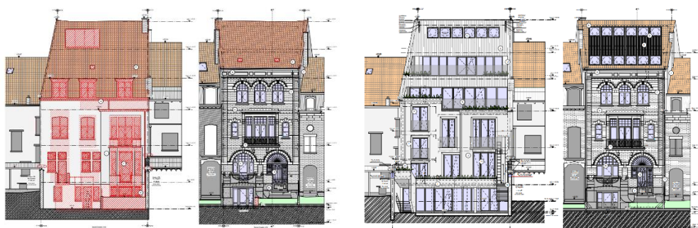
Situation existante et projetée (documents extraits du dossier de demande).