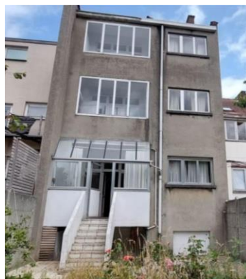
Façade arrière