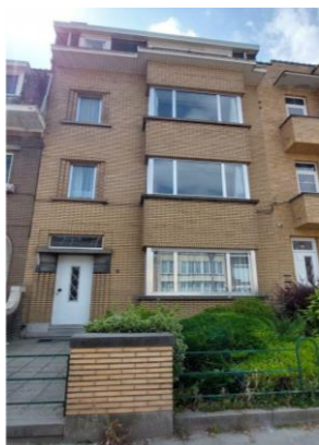
Façade avant

En réponse à votre courrier du 16/09/2024, nous vous communiquons l'avis émis par la CRMS en sa séance du 25/09/2024, concernant la demande sous rubrique.