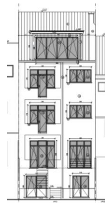
Façade arrière. Situation projetée. Image tirée du dossier

Les interventions projetées n'auront pas d'impact sur les vues vers et depuis le site classé du Scheutbos et constituent une amélioration de la situation existante. La CRMS recommande toutefois l'utilisation du bois également pour les menuiseries en façade arrière.