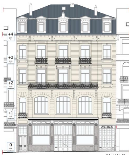
Proposition avec les teintes « 1920 »

Sur base de ces études, deux scénarii de remise en couleur de la façade ont été élaborés. Le premier, qualifié de proposition « 1920 », correspond à la situation existante et prévoit la mise en peinture de la façade dans un ton blanc crème, avec des châssis. Ce scénario s'inspire des enfilades néoclassiques du Parvis, dont plusieurs bâtiments sont peints en blanc. Le second scénario, la proposition « 1906 », applique plus littéralement les résultats de la nouvelle étude stratigraphique, en traitant l'enduit de façade dans un ton gris proche de celui de la pierre bleue, et les faux-joints en noir. Les châssis seraient peints dans une teinte brune. Il est à noter que les saillies disparues au premier étage ne seront pas restituées, faute de documentation suffisante.