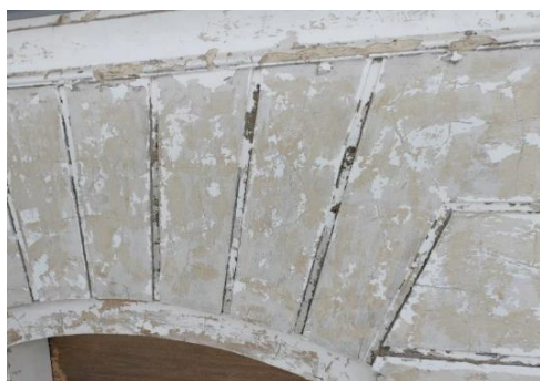
Refends des bossages et faux-joints