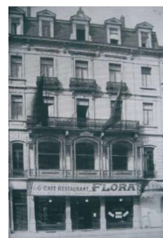
La façade en 1907 (document extrait du dossier)

Le complexe de l'Ægidium est bâti en 1905-1906 dans le cadre d'une opération de promotion immobilière sur le parvis de Saint-Gilles récemment aménagé. Il fait partie du front nord du parvis, constitué d'immeubles de rapport à logements multiples d'inspiration néoclassique tardive, dus à l'architecte Guillaume Segers. Sa façade caractérisée par sa symétrie et son ornementation sobre se développe sur trois niveaux surmontés de combles. Peu après la construction du bâtiment, une galerie vitrée en saillie est adjointe au premier étage, probablement pour signaler davantage depuis le parvis