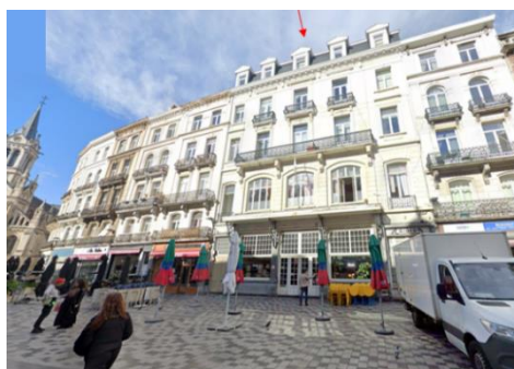
Façade de l'Ægidium avant travaux