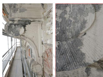
Fig. 13 : console en pierre bleue