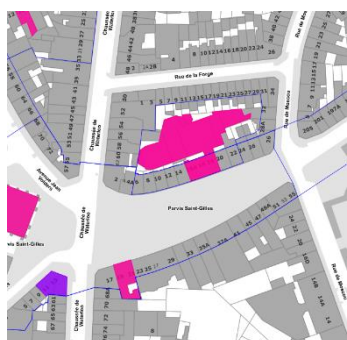
Contexte patrimonial

L'arrêté du 08/06/2006 classe comme monument, en raison de leur intérêt historique, social et artistique, certaines parties de l'ancien cinéma « L'Ægidium » : la façade principale, les toitures ainsi que certaines parties intérieures. Les bâtiments à front de voirie (Parvis de Saint-Gilles, 16 et 18) sont également situés dans la zone de protection d'un ensemble d'immeubles classés sis Parvis Saint-Gilles 11 à 15 (arrêté du 18/03/2004), et dans la zone de protection de l'église Saint-Gilles classée comme monument depuis le 16/03/1995. Le bien se situe en outre en ZICHEE.