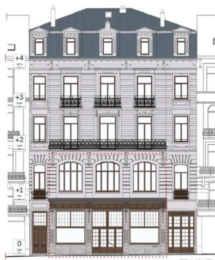
Proposition avec les teintes « 1906 »

Documents extraits du dossier de demande.