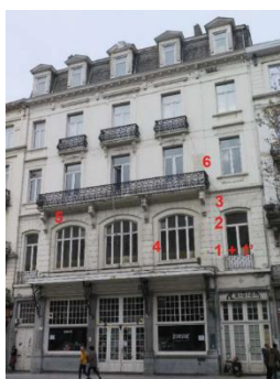
Localisation des nouveaux sondages (doc. extrait du dossier)