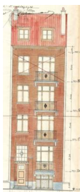
Situation de droit (1936) Image tirée du dossier