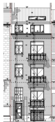
Situation projetée