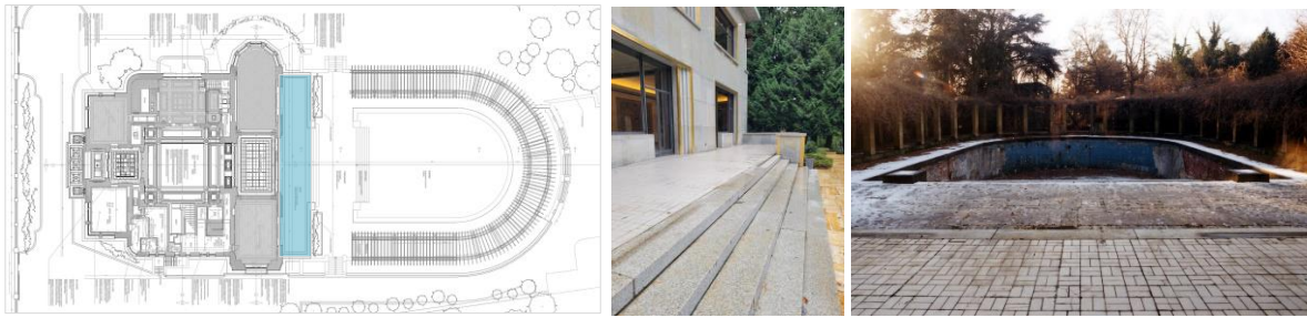
Implantation et état existant de la terrasse (documents extraits de la demande de permis unique concernant la réfection de la terrasse) ; état de la terrasse en 1997

la terrasse. Celui-ci était déjà en place dans les années 1990 et constitue à ce jour le seul revêtement documenté de la terrasse.