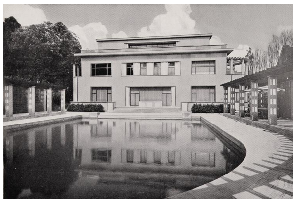
Photos d'époque parues dans la revue La Technique des Travaux, 8, 1935

Construite au début des années 1930 pour le baron Louis Empain par l'architecte Michel Polak, cette villa constitue un des plus remarquables exemples d'architecture Art déco en Région bruxelloise et présente un intérêt patrimonial exceptionnel. Elle a été classée comme monument par arrêté du 29/03/2007 pour ses façades et toitures, la totalité du rez-de-chaussée et du premier étage ainsi que la totalité de son jardin et des grilles qui l'entourent.