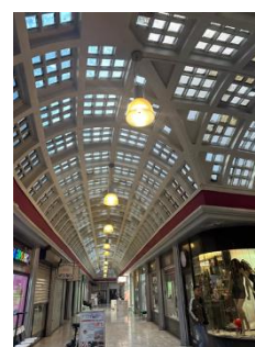
Plan et photo extr. du dossier de demande