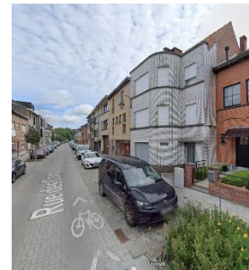
Façade avant du bâtiment