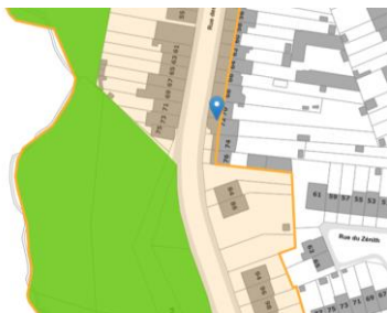
Contexte patrimonial

En réponse à votre courrier du 08/08/2024, reçu le 13/11/2024, nous vous communiquons l'avis émis par la CRMS en sa séance du 27/11/2024, concernant la demande sous rubrique.