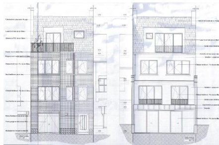
Situation projetée (Document extrait du dossier)