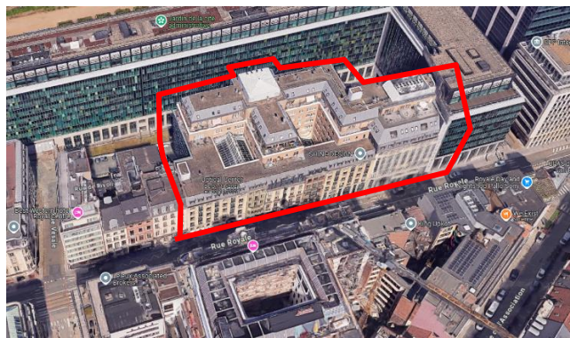
Vue aérienne du complexe