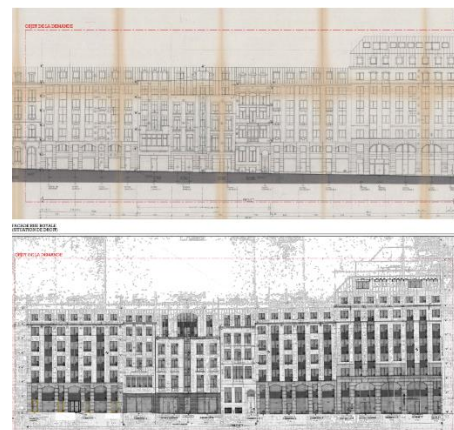
Situation de droit et situation de fait (Documents extraits du dossier de demande)