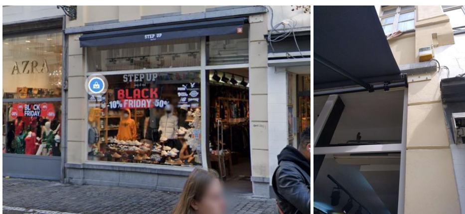
Situation de fait de la devanture et détail du système de fixation en place

La présente demande vise à régulariser le système actuellement en place.