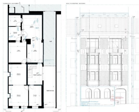
Situation projetée (document extrait du dossier de demande)

La couverture de la cour dont la régularisation est demandée n'a pas d'impact négatif sur les vues vers et depuis l'abbaye de Forest classée. La CRMS constate toutefois la présence en façade avant de châssis PVC peu qualitatifs. Elle se questionne en outre sur l'équipement de la baie centrale (volet, obturation de la partie supérieure). Il y a lieu de vérifier la régularité de cette situation, et le cas échéant de remplacer les châssis par des modèles en bois adaptés à la typologie de ce bel immeuble. L'élévation de la façade à rue jointe au dossier indique également le déplacement projeté des boîtes à lettres vers la porte cochère en ferronnerie. Cette intervention doit être effectuée de manière discrète et intégrée, sans porter préjudice à la porte ouvragée.