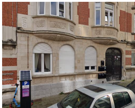
Façade avant et châssis PVC