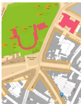
Contexte patrimonial

En réponse à votre courrier du 06/11/2024, reçu le 08/11/2024, nous vous communiquons l'avis émis par la CRMS en sa séance du 27/11/2024, concernant la demande sous rubrique.