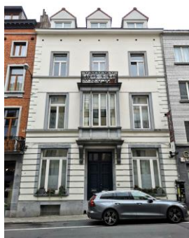
Façade avant du bien (document extrait du dossier)