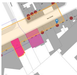
Contexte patrimonial (@ BruGIS)

En réponse à votre courrier du 20/11/2024, nous vous communiquons l'avis émis par la CRMS en sa séance du 27/11/2024, concernant la demande sous rubrique.