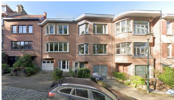
Enfilade et bien concerné par la demande