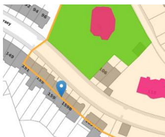
Contexte patrimonial

En réponse à votre courrier du 08/11/2024, nous vous communiquons l'avis émis par la CRMS en sa séance du 27/11/2024, concernant la demande sous rubrique.