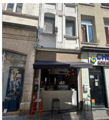
Situations existante