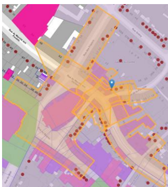
Localisation du projet

En réponse à votre courrier du 26/11/2024, nous vous communiquons l'avis émis par la CRMS en sa séance du 18/12/2024, concernant la demande sous rubrique.