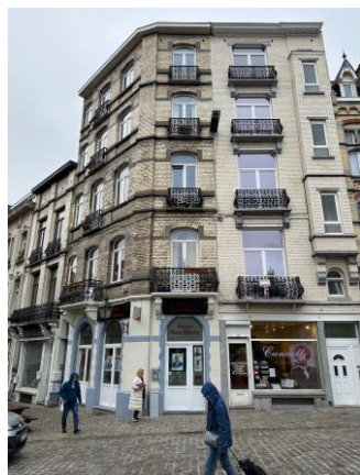
Situation existante