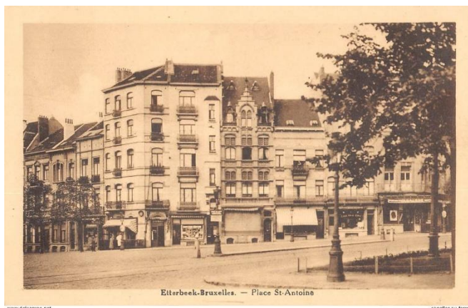
Carte postale ancienne