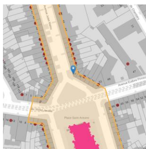
Localisation du projet

En réponse à votre courrier du 29/11/2024, nous vous communiquons l'avis émis par la CRMS en sa séance du 18/12/2024, concernant la demande sous rubrique.