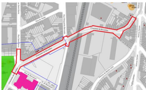
Emprise du projet dessinés par la CRMS sur le plan de la situation patrimoniale Brugis©

En réponse à votre courrier du 02/12/2024, reçu le 02/12/2024, nous vous communiquons l'avis émis par la CRMS en sa séance du 18/12/2024, concernant la demande sous rubrique.