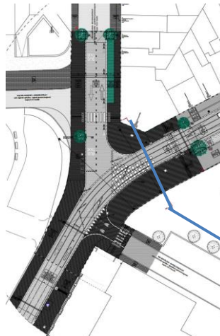
Carrefour Saint-Denis. Situation projetée