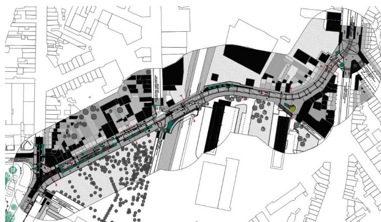
Situation projetée globale du projet

La présente demande est la seconde partie du projet de réaménagement de la Chaussée de Bruxelles. Elle concerne désormais le tronçon entre l'Hôtel communal de Forest et le rond-point Zaman. La partie devant l'Hôtel communal (classé) qui figurait dans la première demande est à nouveau intégrée dans celle-ci car le projet de réaménagement du carrefour entre la chaussée et les rues Saint-Denis et de Barcelone a été modifié pour des raisons de sécurité routière.