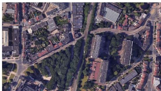
Vue aérienne de la Chaussée de Bruxelles.

Le périmètre du projet est partiellement compris dans la zone de protection de l'Abbaye de Forest et de ses jardins, classés comme site (AG du 08/09/1994). Une partie de l'emprise du projet se situe devant l'Hôtel communal de Forest classés comme monument (AG du 22/10/1992).