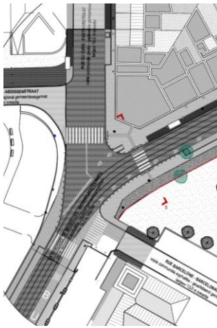
Carrefour Saint-Denis. Situation existante.