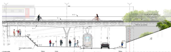
Coupe projetée de la chaussée à hauteur du pont.