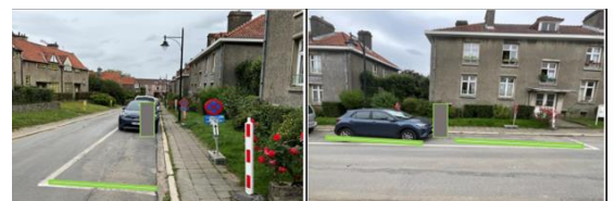
fotomontage uit de aanvraag

De huidige aanvraag betreft de plaatsing, in het kader van de aanbesteding "ChargyClick 2.0", van een laadpaal op de rijbaan ter hoogte van de Petuniastraat 1 in Watermaal-Bosvoorde. Naast de eigenlijke laadpaal omvat de installatie ook: