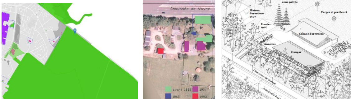
Localisation image aérienne augmentée de l'implantation des différentes constructions au fil du temps extraite de l'étude historique 1 , implantation projetée extraite du dossier

En réponse à votre courrier du 17/12/2024, nous vous communiquons l'avis conforme favorable sous conditions émis par notre Assemblée en sa séance du 15/01/2025, concernant la demande sous rubrique.