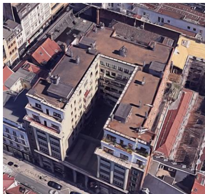
Vue aérienne de l'immeuble

En réponse à votre courrier du 23/12/2024, nous vous communiquons l'avis émis par la CRMS en sa séance du 15/01/2025, concernant la demande sous rubrique.