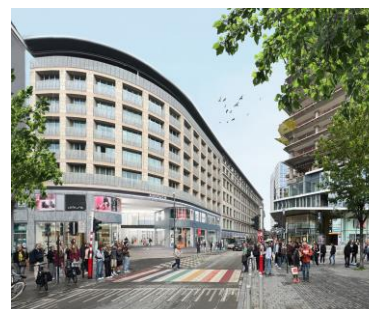
Wijzigingsaanvraag. Afbeelding uit het bestand.