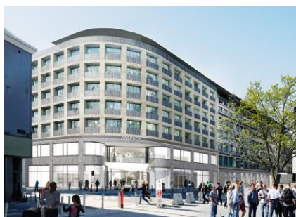
Project 2023. Archief KCML.